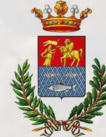
Città di Rieti