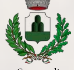
Comune di Monte Compatri