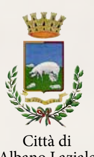
Città di Albano Laziale