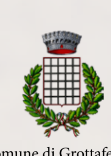
Comune di Grottaferrata