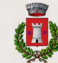
Città di Rocca di Papa