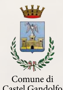
Comune di Castel Gandolfo