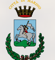
Città di Marino